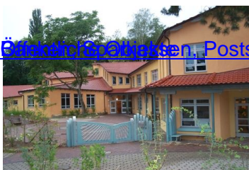
Ökostrom, Ölgasen, Poststellen